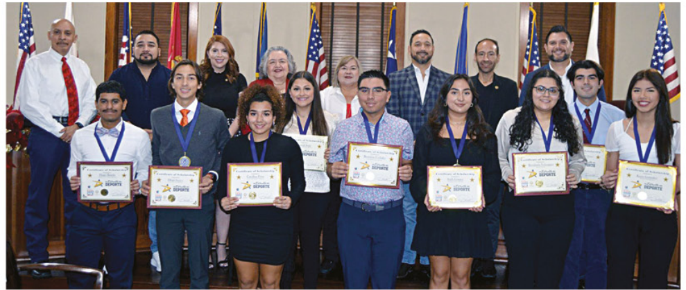
Los 9 mejores atletas locales fueron reconocidos en el programa La Estrella del Deporte para el mes de diciembre.