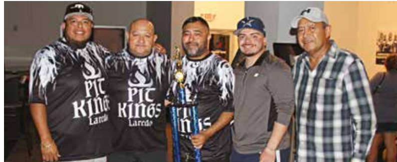
Los integrantes del equipo del Sheriff Martín Cuellar se quedaron con el segundo sitio.